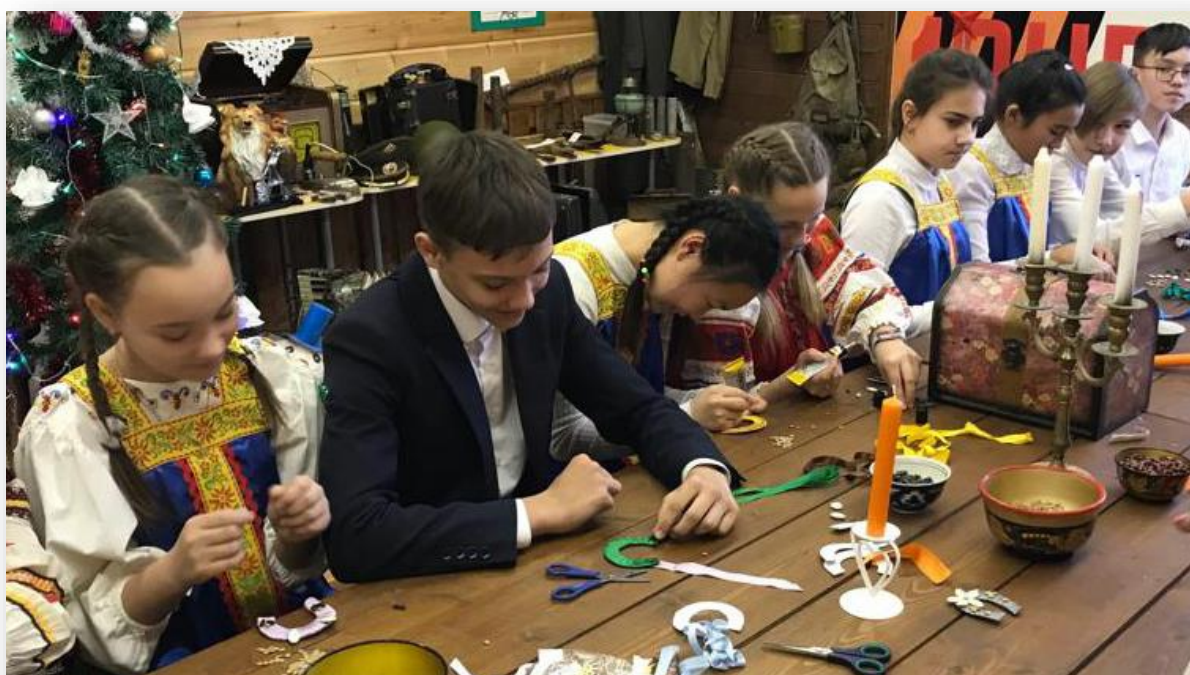
Приложение 8. Очередной мастер-класс в музее.

* Основой костюма была длинная рубашка прямого кроя «сорочица», которая шилась из домотканого плотна, с широкими рукавами. Обычно, женщина надевала не одну такую рубашу (минимум еще одна выступала в качестве нижнего белья). Одежда русской крестьянки состояла из такой вот рубашки, украшенной вышивкой, которая в русском народном костюме обычно размещалась на рукавах, подоле и по плечам. Сверху надевали однотонный сарафан, а также передник. 1