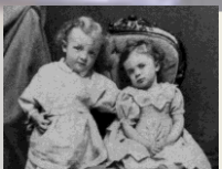
1874 года, Володя Ульянов с сестрой Ольгой. По фрагменту этой фотографии были сделаны октябрятские значки.