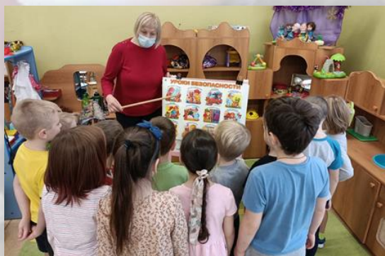
«Правила безопасного поведения»