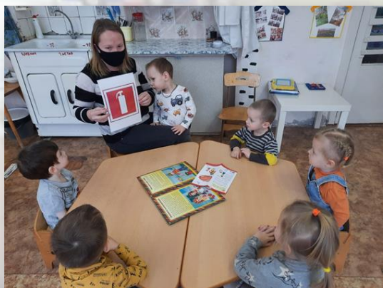
«Час по безопасности»