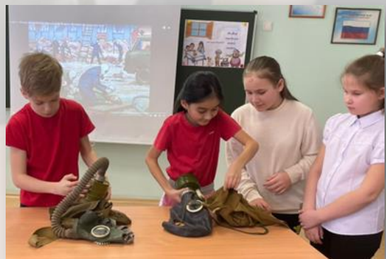
«Действия при пожаре»