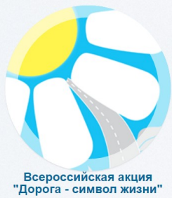
Всероссийская семейная акция "Дорога - символ жизни"