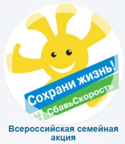
Всероссийская семейная акция