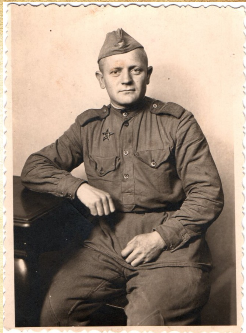
Прадед в 1945.