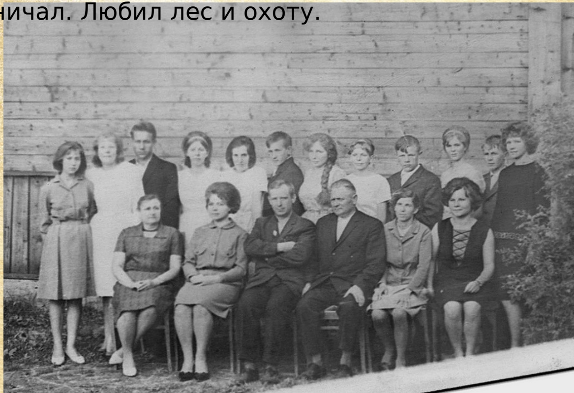
С учениками школы

Выход на заслуженный отдых. Всю свою жизнь он не боялся физической работы, дом построил сам, обрабатывал сад и огород, держал скотину, улья. По воспоминаниям родственников очень хорошо плотничал. Любил лес и охоту.