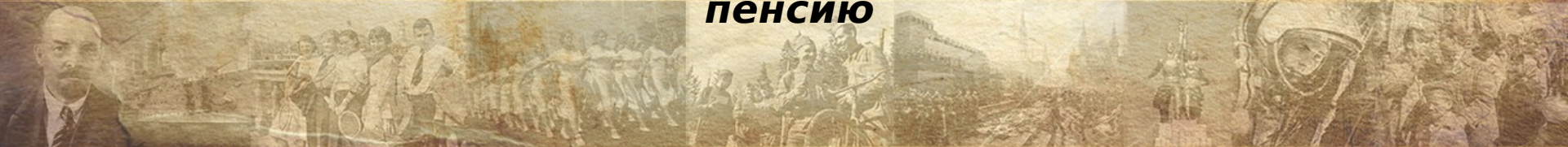
Запись в трудовой о выходе на пенсию