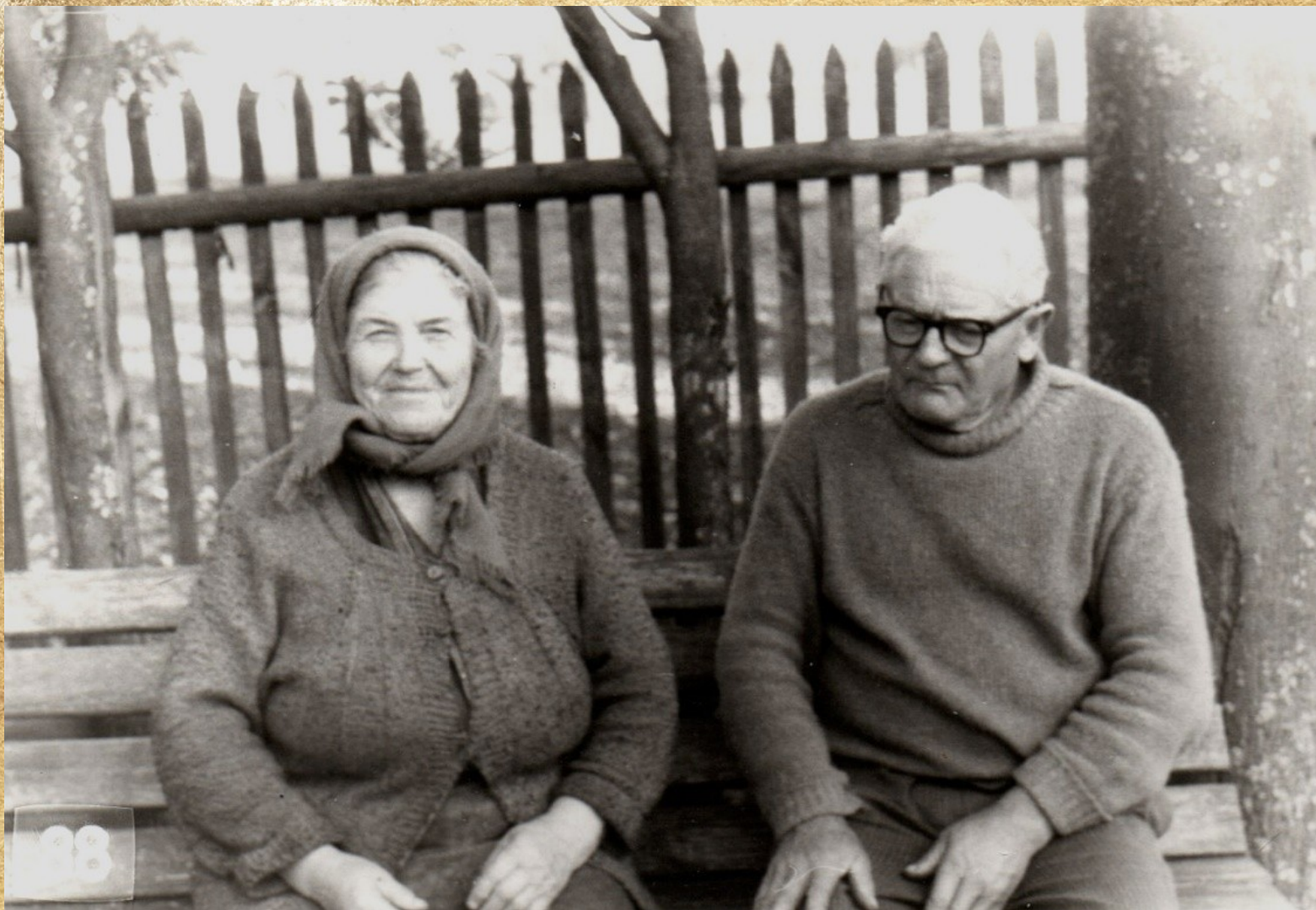
На лавочке у дома