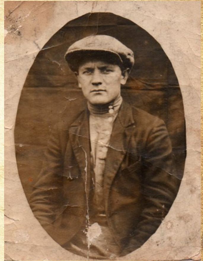
Прадед в довоенные годы.

В дальнейшем своём исследовании я обратился к официальным электронным ресурсам Министерства Обороны России: «Подвиг народа» и «Память Народа». Прочитал книгу П.А. Белова «За нами Москва», изучил журнал боевых действий партизанского отряда «Северный медведь», ознакомился на интернет-ресурсах с разрозненными