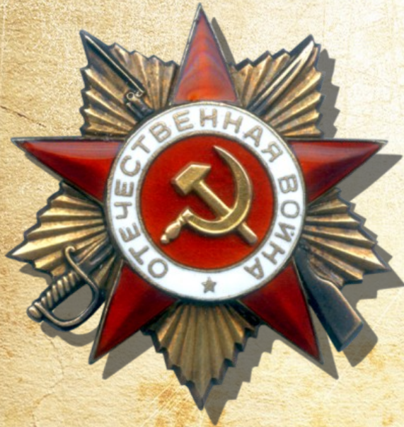
Орден Отечественной войны

Победу над Германией он встретил под Кенигсбергом. В послевоенный период мой прадед также был награжден «Орденом Отечественной Войны» и «Медалью за Победу над Германией», различными юбилейными наградами.