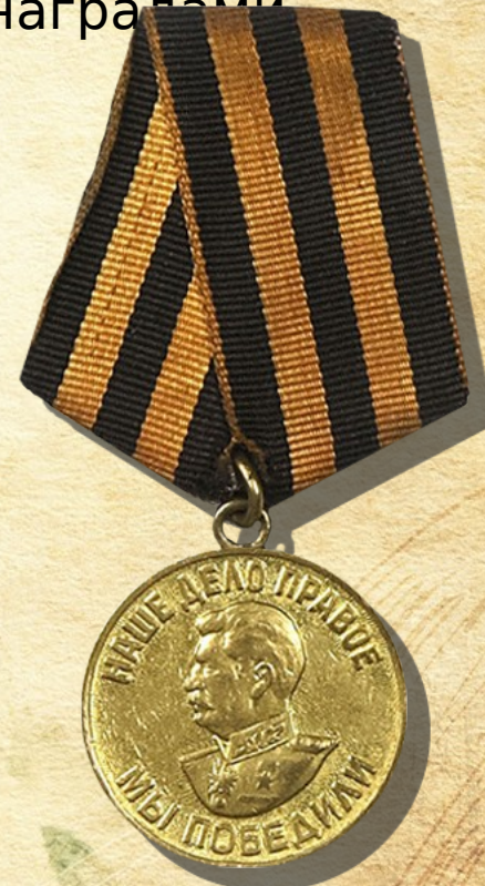
Медаль за Победу над Германией