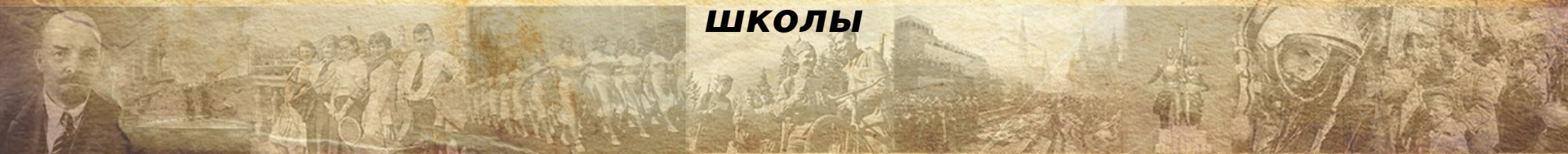
Запись в трудовой о назначении директором ШКОЛЫ