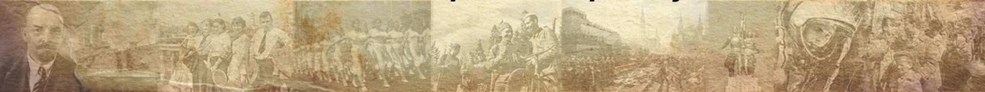
Запись о приеме на работу