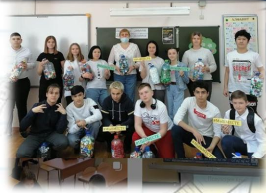
Традиционно е участие в акции «Добрые крышечки»