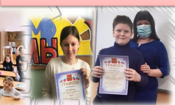
В первых классах прошёл праздник «Прощание с азбукой».