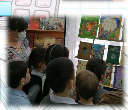
Неделя детской и юношеской книги в школе